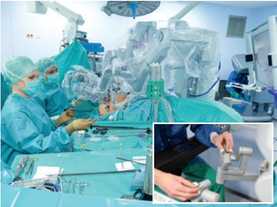
Roboterassistierte „da Vinci“-Operation in einem der neuen OP-Säle am Campus Kiel: Im Vordergrund der Patientenwagen, die mikrochirurgischen Instrumente wurden über kleinste Schnitte in den Körper des Patienten eingeführt. Sie sind an die in Schutzfolie eingehüllten Roboterarme angeschlossen. Hinten rechts der Chirurg an der Konsole: Von hier aus steuert er über zwei Bedienelemente für die Finger (kleines Bild) die Instrumente an den Roboterarmen.

Interdisziplinärer Austausch als treibende Kraft für Innovationen „Miteinander, füreinander und voneinander lernen“ lautet das Motto der sieben Mitglieder des Kurt-Semm-Zentrums. Denn ein enger kollegialer Austausch beschleunigt nicht nur den Lernprozess beim roboterassistierten Operieren erheblich, er fördert auch die Kreativität und ebnet den Weg für die Entwicklung neuer Methoden, Zugangswege und