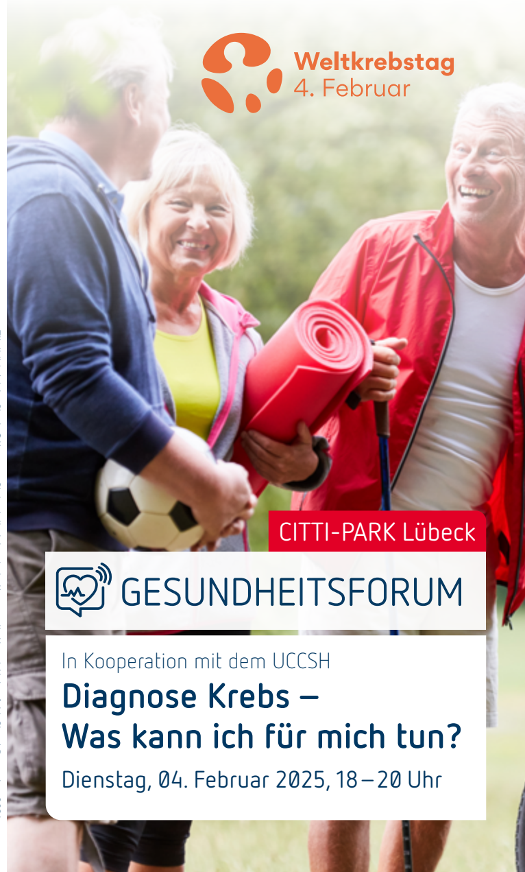
Statusstelle Integrierte Kommunikation, J. Hahnefeld, Stand Dezember 2024