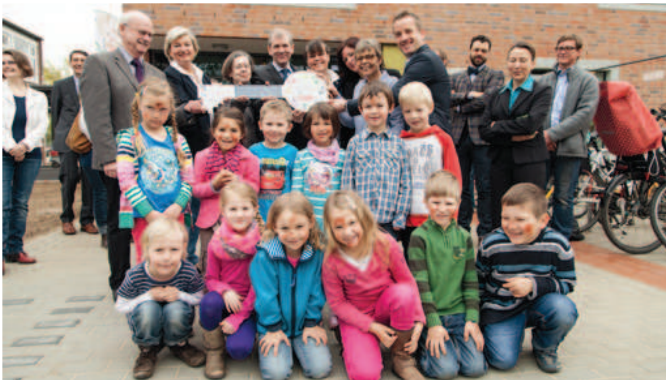
Mit einer feierlichen Schlüsselübergabe wurde die neue UKSH-Kita an der Grundschule Grönauer Baum in unmittelbarer Nähe zum Campus Lübeck eingeweiht.

und allen kleinen Nutzerinnen und Nutzern ganz viel Spiel und Spaß in dem neuen, schönen Haus.“