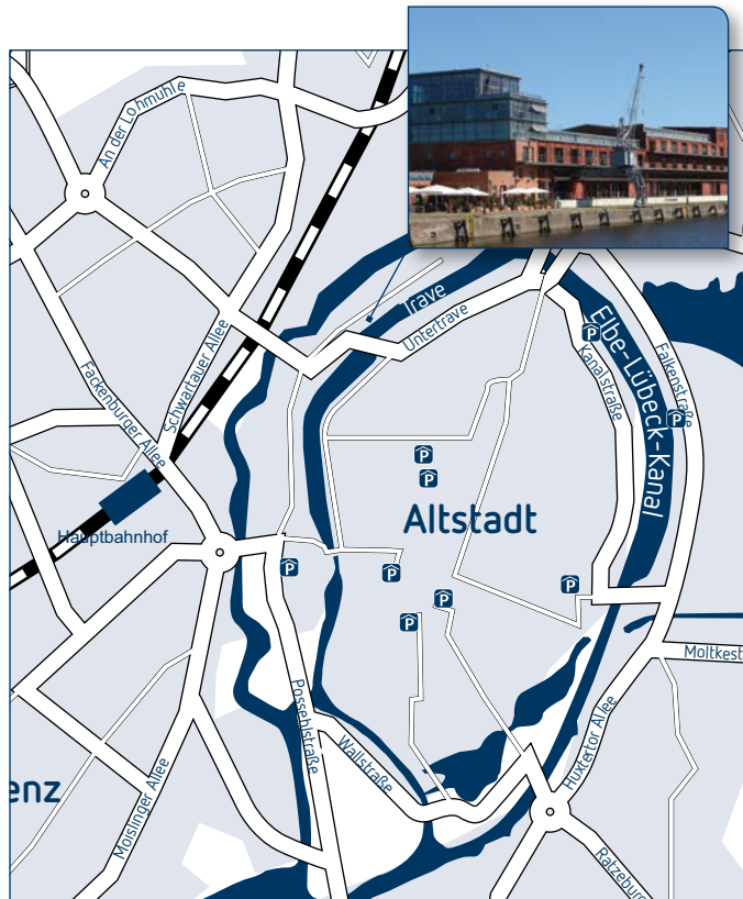
Treibbild: © TTstudio - Fotolia.com; Stabstelle Integrierte Kommunikation, G. Weinberger, Stand Juli 2015

Media Docks Willy-Brandt-Allee 31 23554 Lübeck