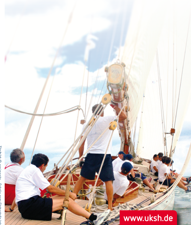
Treibbild © argironeta - Fotolia.com; Stabsstelle integrierte Kommunikation, G. Weinberger, Stand April 2014