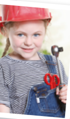
Line aus der UKSH KITA Kiel