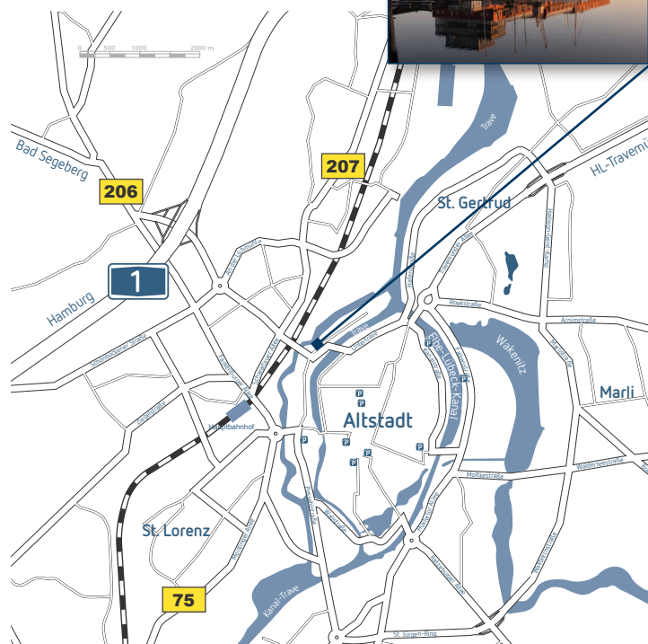
Titelbild: Adobe Stock – @peterschreibermedia; Stabsstelle Integrierte Kommunikation; G. Weinberger, Oktober 2024